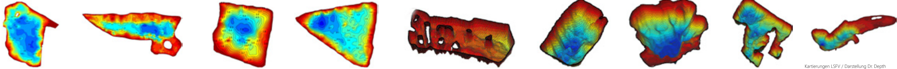
Kartierungen LSFV / Darstellung Dr. Depth