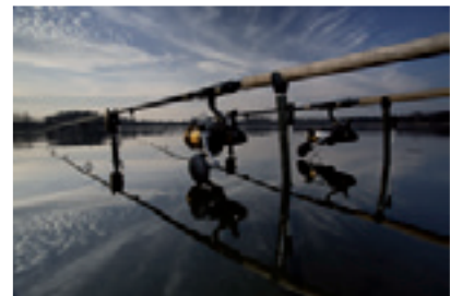
Sommerzeit - Angelzeit