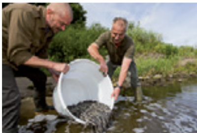
Aalbesatz in der Weser