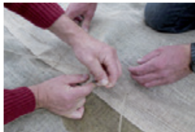
Jute gegen Wasserpest