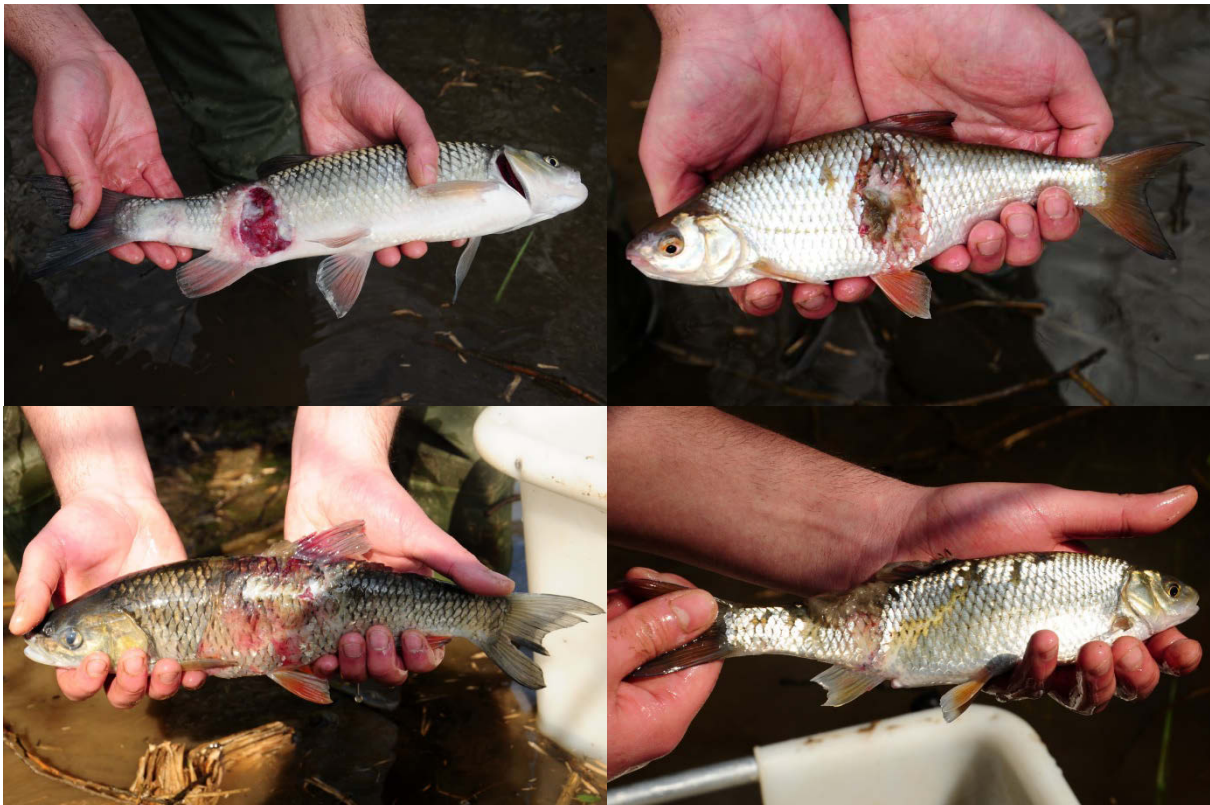
Abb.1: Fische, die im Rahmen einer Bestandsbergung in der Leine bei Hannover gefangen wurden. Deutlich sind die Bissverletzungen, verursacht durch Kormorane, und die nachfolgenden Verpilzungen zu erkennen.

Häufig findet man Angaben, dass mindestens nochmals die gleiche Menge Fisch durch Kormorane verletzt wird und anhand der Verletzungen verendet. Diese Aussagen entbehren einer wissenschaftlichen Grundlage und sind somit nicht völlig korrekt, denn die genauen Zahlen infolge von Bissverletzungen verendeter Fische lassen sich faktisch nicht beziffern. Außer Frage steht jedoch, dass größere Fische häufiger gravierende Verletzungen durch Kormorane davontragen und somit anfällig für parasitäre Infektionen und Nekrosen sind, die auch zum Tode führen können (Adámek et al. 2007; Kortan et al. 2008; Abb. 1). Untersuchungen an Aalen am Dümmer haben gezeigt, dass mit steigender Fischgröße auch die Häufigkeit von Bissspuren zunimmt. Beispielsweise wurden im September 2008 bei über 68 % der untersuchten Aale Bissspuren nachgewiesen (Emmrich & Düttmann 2010). Durch ihre Jagd können Kormorane auch indirekte Massensterben von Fischen auslösen, indem sie Fische z.B. in sauerstofffreie Gewässerbereiche von tiefen Seen jagen, wo sie dann ersticken (Dettmann 2014).